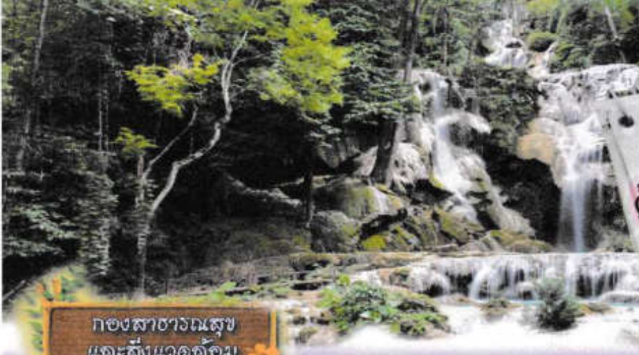
กองสาธารณสุข และสิ่งแวดล้อม

ยุทธศาสตร์ที่ ๒ ด้านการพัฒนาคุณภาพ ชีวิตของประชาชน