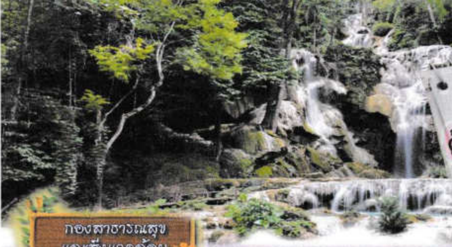
กองสาธารณสุข และสิ่งแวดล้อม

ยุทธศาสตร์ที่ ๒ ด้านการพัฒนาคุณภาพ ชีวิตของประชาชน